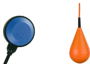
Niveauregler Typ SMALL oder MS