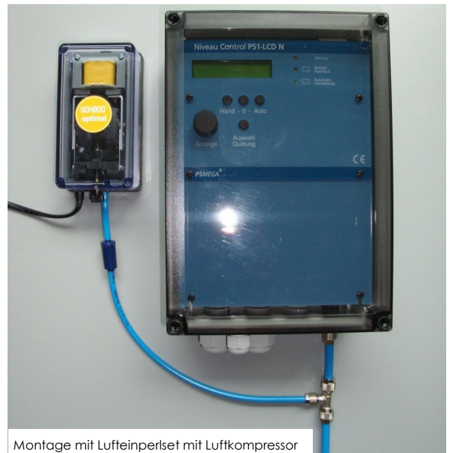
Montage mit Lufteinperlset mit Luftkompressor