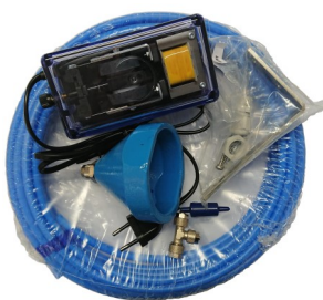
Lufteinperlset mit Luftkompressor