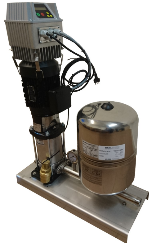
Model SEVMSV 5 6N/1.1

Sie wird installiert, wo der Förderdruck vom Kommunalnetz nicht ausreichend ist, oder wenn die Wasserversorgung von einer Quelle oder von einem Regentank stammt.