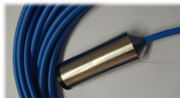
Sonde 4-20 mA