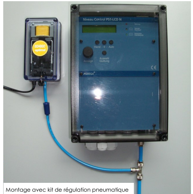
Montage avec kit de régulation pneumatique